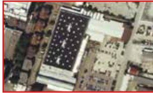
GIF IV Neckarsulm