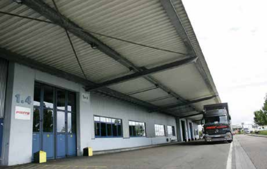
Fritz-Halle in GIF I

Aber nicht nur für die Automobillogistik bewegt das Unternehmen viel, auch andere Bereiche der Logistik wie Lebensmittellogistik, Chemikalienlogistik, Maschinenbaulogistik oder Lagerlogistik decken die Logistikprofis sehr erfolgreich ab. Die Aktivitäten der Firmengruppe beschränken sich aber nicht nur auf logistische Dienstleistungen. Ob Sammelguttransporte, Systemverkehre, Spezialtransporte wie druckverflüssigtes Gas, internationale Verkehre, komplette Zollabwicklungen oder Sonderfahrten 24 Stunden täglich, an 365 Tagen – Fritz ist immer der spezialisierte Fachmann für anspruchsvollste Dienstleistungen. Hier liegt auch eine der größten Stärken des Unternehmens. Spezialisiertes Knowhow, jahrzehntelange Erfahrung, modernster Fuhrpark und Equipment