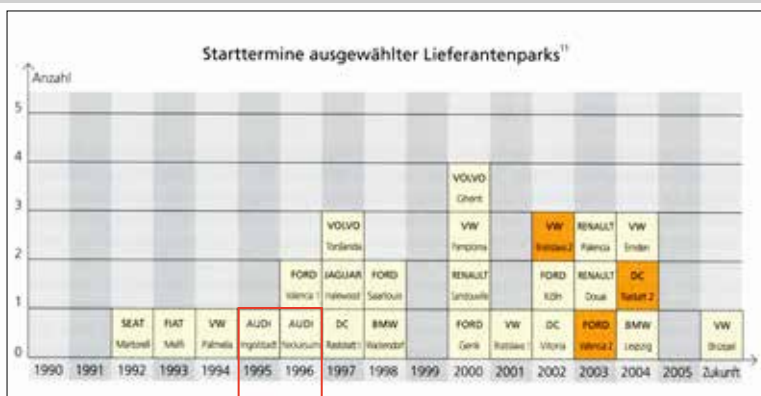
Abbildung 1 – 2: Starttermine ausgewählter Lieferantenparks 11

von Dr. Holger Barthel, Limburg, deutlich: