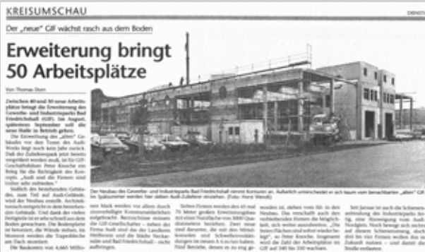
Heilbronner Stimme vom 27.06.1997

Schon zum Zeitpunkt der Einweihung ist deutlich geworden, dass die neu erstellten Hallenflächen nicht ausreichen. Die Gesellschafter haben deshalb bereits im Januar 1997 mit GIF II den Neubau einer weiteren Halle mit ca. 3.000 qm südlich der bestehenden Halle beschlossen. Schon im September 1997 wurde diese Halle bezogen.