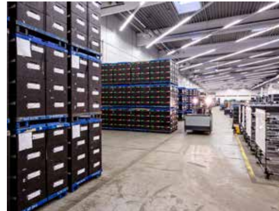
GIF IV Innenansicht

Der Mut der handelnden Personen dieses Projekt vor 20 Jahren zu beginnen, viel Überzeugungsarbeit zu leisten und den Erfolg Jahr für Jahr sicher zu stellen, ist und bleibt daher ein starkes Signal für die Zukunftsfähigkeit unseres Standortes.