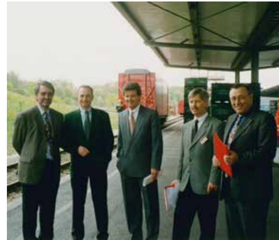
Inbetriebnahme des Gleisanschlusses am 24.04.1998

Bereits während der Planungsphase war der Anschluss des Gewerbe- und Industrieparks an das Schienennetz vorgesehen. Das Land förderte dieses Vorhaben, so dass im Frühjahr 1998 der Gleisanschluss in Betrieb gehen konnte.