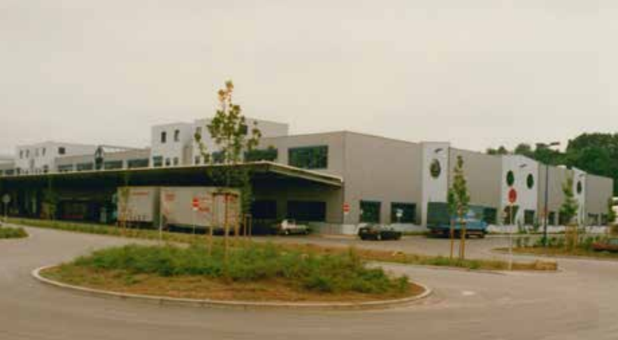
Halle GIF I, von Südwesten