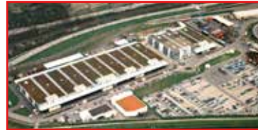
GIF I bis III Bad Friedrichshall