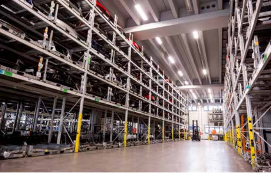
GIF III Innenansicht

hinaus entlastet er durch den Transport großvolumiger Teile auf kürzestem Weg die Infrastruktur und schont die Umwelt. Beispielsweise werden die Grundstoffe für den Bodenteppich kompakt angeliefert und erst im GIF entsteht das verbaufähige, großvolumige Teil.