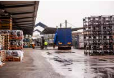
GIF I, Anlieferung

20 Jahre sind eine lange Zeit, die Vielzahl technologischer Veränderungen verdeutlicht dies auf beeindruckende Weise. Vieles von damals ist in der heutigen Zeit veraltet und überholt. Nicht so der GIF, sein Konzept und seine Bedeutung für unseren Standort Audi Neckarsulm. Die Ziele des Projektes sind heute immer noch aktuell und gewinnen sogar weiter an Bedeutung.